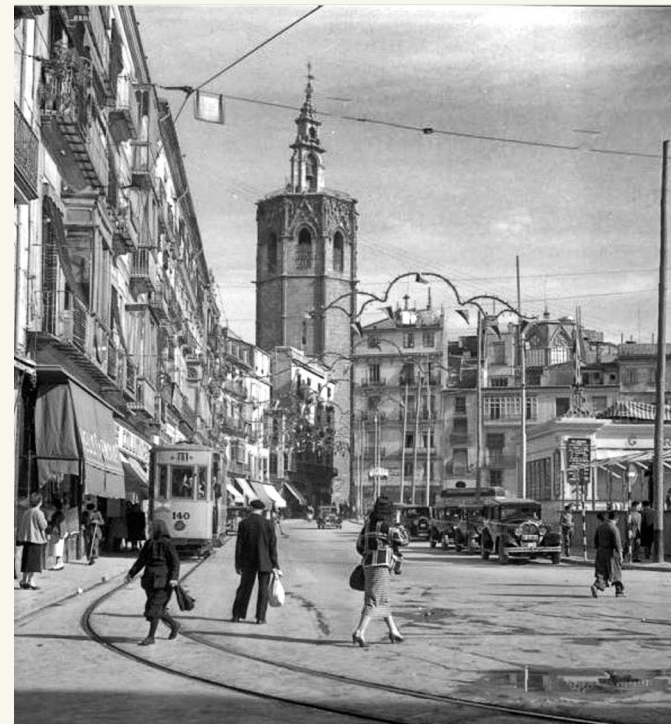
IMG. 01 PLAZA DE LA REINA, VALENCIA

Con el orgullo de nacer en Valencia, apostamos por un producto completamente local. Todas nuestras telas se tejen en la Comunidad Valenciana, en telares Jacquard con profesionales del sector. De la misma manera, confeccionamos las prendas buscando mantener la máxima calidad y cuidado.